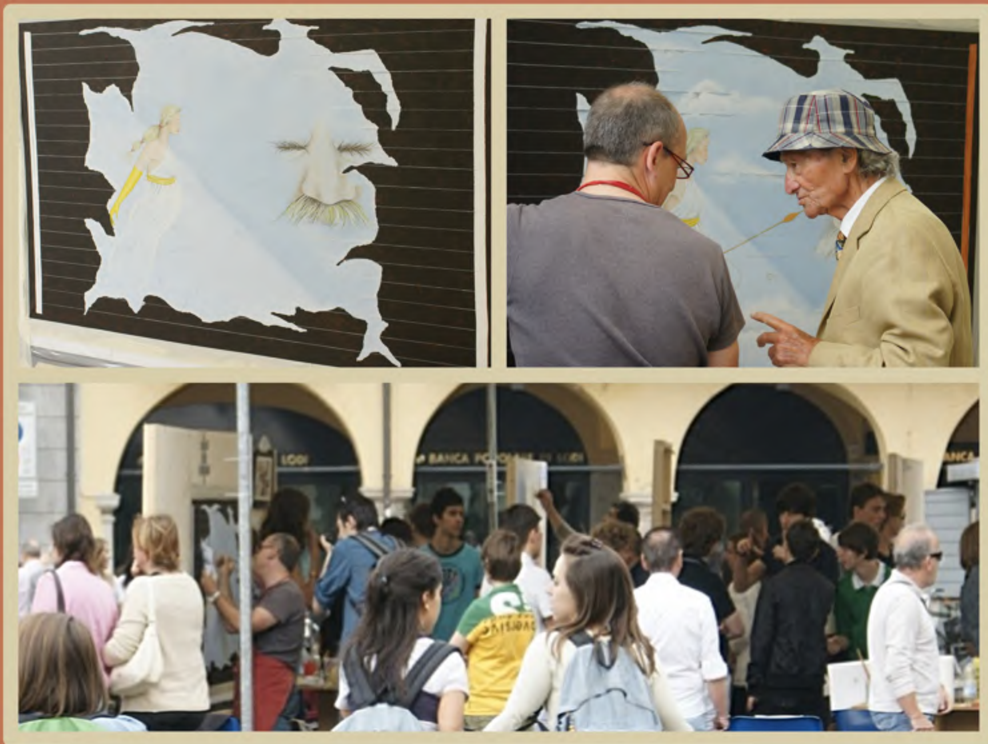
Dag 2: vandaag worden de grotere elementen geschilderd, zodat we op de laatste dag enkel het hout en de lijnen moeten afwerken. De mensen stromen echt toe, gelukkig zijn er niet veel die engels kunnen, toch moet je gewoon geraken aan de foto's die constant genomen worden. (het land van de paparazzi)