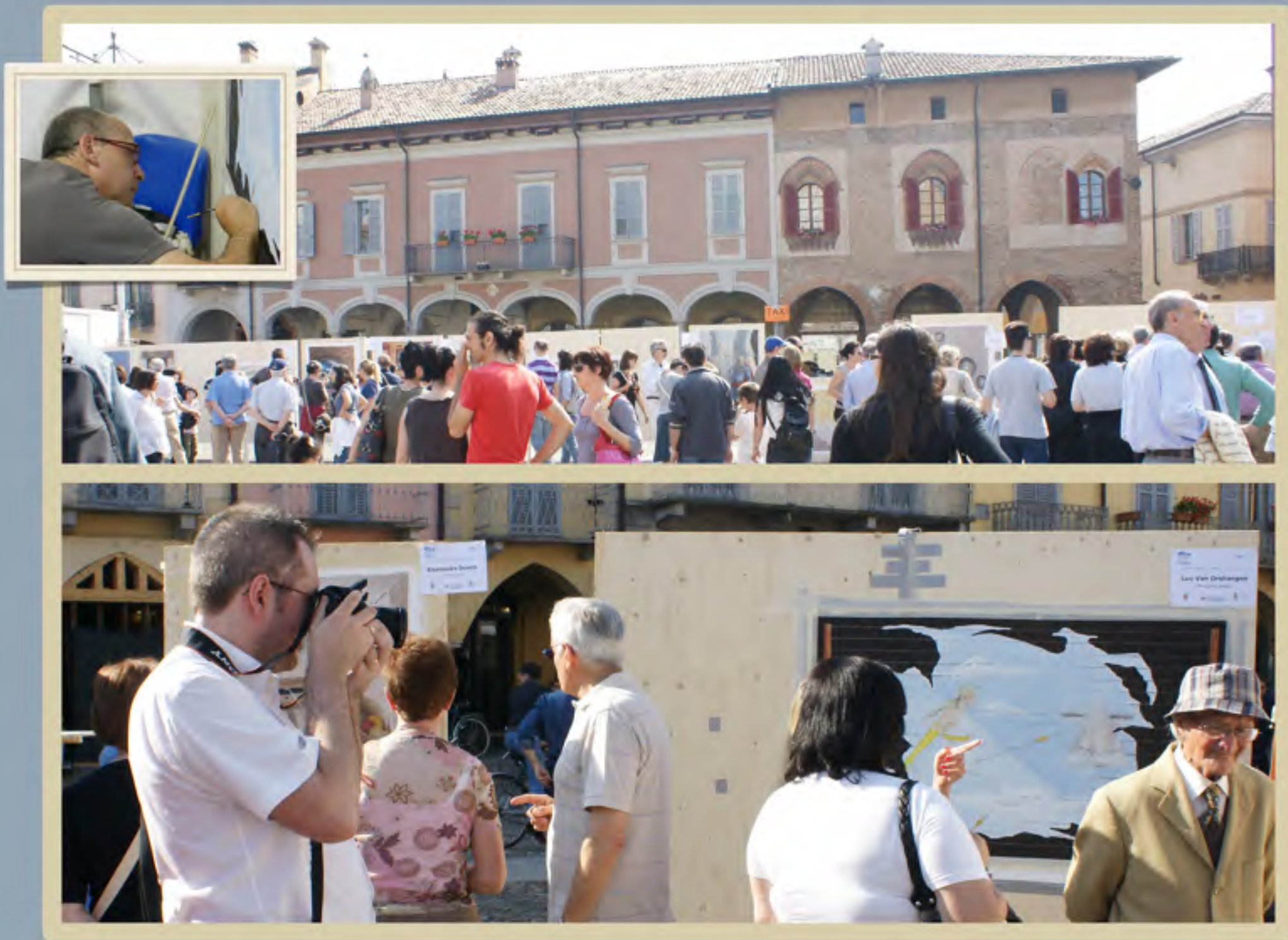
De ganse organisatie was een overdonderend succes... deze mensen hebben ons echt in de watjes gelegd....elke maaltijd mee uitgenomen... zeer vriendelijk en behulpzaam....het publiek zeer tevreden, maar de volgende keer moet ik wel absoluut wat Italiaans kennen!