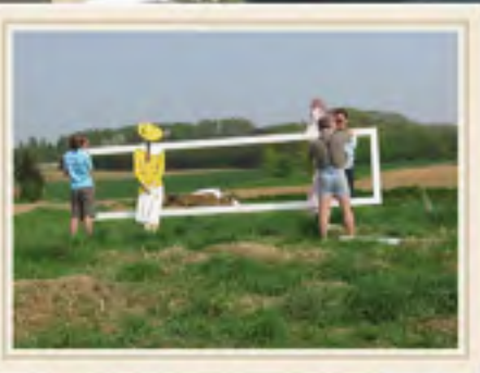
Het werk wordt opgebouwd voor LOKART...kunst op lokatie, we hebben een plaats gekregen in de open natuur.... prachtig. Het werk, 'In Progress' is 4 x 1,8 m groot. Na enige tijd hebben we de juiste richting voor de opstelling gevonden. De installatie kan beginnen, het moet zeer stevig zijn, de open horizon is prachtig maar ook open voor elke weersverwachting en vandalisme.