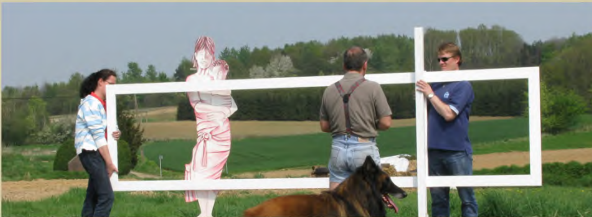
Het kunstwerk krijgt vorm, de opstelling komt zeer goed tot zijn recht in deze wilde weide, nog wat afwerken en het staat klaar voor de eerste openlucht tentoonstelling LokART in Kortenberg.