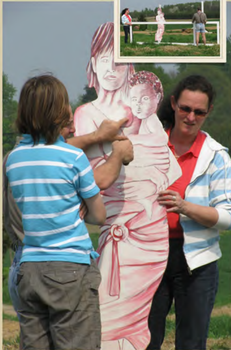
Bingo: hoe zat het weer in elkaar? Moet de onvoltooide figuur achter of voor de kader staan en op welke paal, we gaan het even uittesten om zeker te zijn. De voorbijkomende fietsers kijken vol bewondering de verdere evolutie.....het komt wel goed