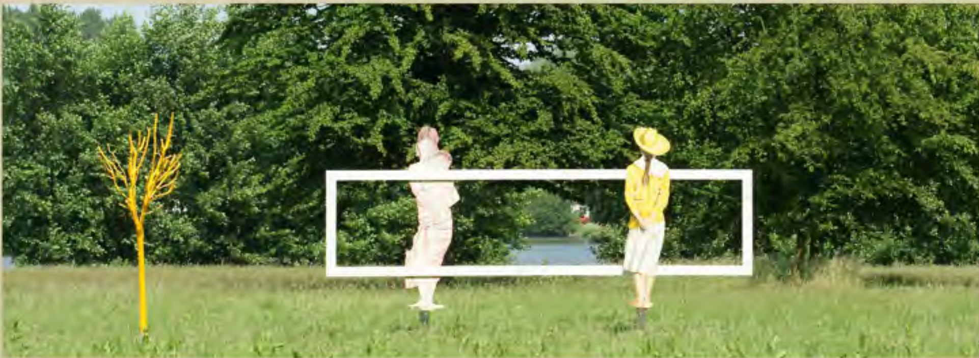
De installatie staat zeer mooi.....op een 100 meter van het pad.... een prachtig zicht op verschillende vijvers en in het verlengde van de oude dreef... spijtig dat ze na de tentoonstelling terug moet.